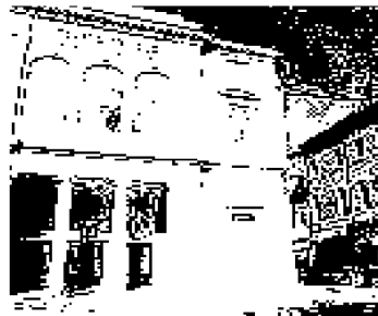
► L'ingresso del Toniolo

■ «Questo piazzale porta il nome di mio padre, che fu il primo Prefetto a entrare nelle scuole e a parlare apertamente di lotta alla mafia. Ma è intitolato virtualmente a tutte le vittime della criminalità e ai loro parenti». Con queste parole l'onorevole Nando Dalla Chiesa ha accompagnato la benedizione dello spiazzo intitolato al padre, il generale Carlo Alberto Dalla Chiesa, davanti al Tribunale dei minori di via Bissa a Mestre. È stato questo l'appuntamento clou dell'edizione 2008 del "Memory Day", promosso dal sindacato di polizia Coisp, dalla Ferriveredo e dal Comune di Venezia. All'appuntamento mattutino al Toniolo hanno partecipato decine di studenti delle scuole cittadine, per rendere concreto l'invito a non dimenticare rilanciato a ogni intervento che si è succeduto sul palco. Presenti tra gli altri il capo della Polizia di