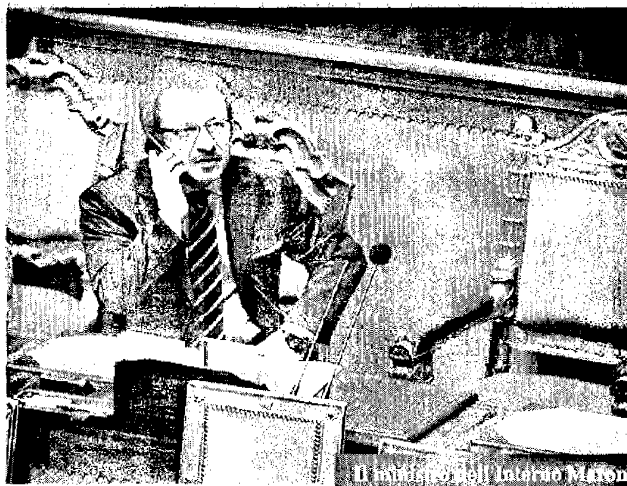
Il ministro dell'Interno Manganelli

“ Come forze di polizia siamo chiamati a stare vicini ai cittadini, a tutelare e a garantire i diritti di tutti, sia nel momento dell'espressione del dissenso che del consenso