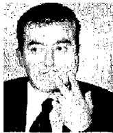
Alfredo Mantovano, sottosegretario all'Interno

Sui ministeri si è abbattuta la mannaia dei tagli e la sicurezza rischia di pagare un pesante pedaggio. Ma il sottosegretario all'Interno Alfredo Mantovano - intervenuto ieri a Mestre al Memory Day del Coisp - non ci sta. Non solo rilancia la palla dei tagli nel campo avverso, ma annuncia anche i rimedi: sarà la criminalità a pagare la sicurezza.